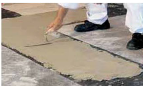
Predisposizione della guaina per l'umidità di risalita