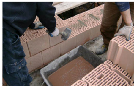
Posa blocco con tasca riempita