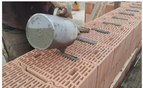
Riempimento delle tasche di malta.

Le componenti del sistema sono: blocchi PLAN, malta speciale per giunti sottili (fornita assieme ai blocchi), mescolatore, rullo stendi malta, secchio, bacinella. Prima della realizzazione del primo corso di blocchi deve essere realizzato un massetto di un paio di cm che consenta la posa a livello dei blocchi. A piano terra, o a diretto contatto con la fondazione, si deve valutare l'utilizzo di una guaina tagliamuro e di un isolamento adeguato per il taglio termico.