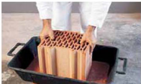
L'applicazione della malta per immersione