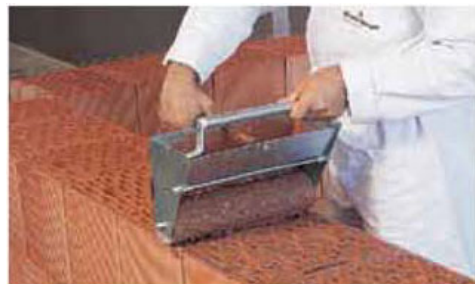
Stesura con l'apposito rullo