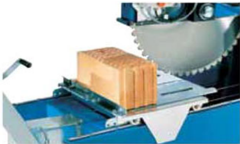
Taglio con idonea sega ad acqua. In alternativa sega a banco o motosega con lama per laterizio