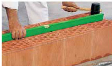
Livellamento del primo corso