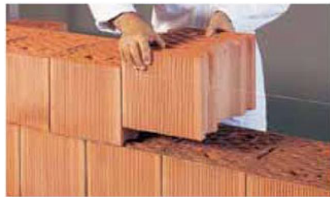
Posa dei blocchi