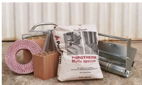
Le componenti del sistema