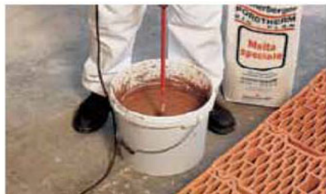
Preparazione della malta speciale