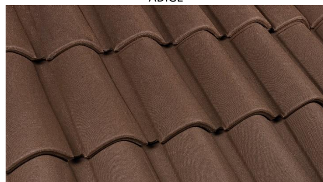
TESTA DI MORO